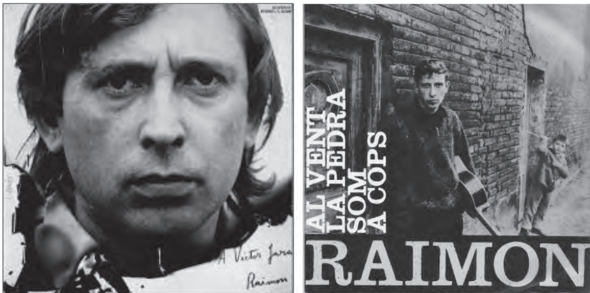
FIGURA 4. Raimon expressa que els joves volien viure «al vent del món».

El maig del 1962, els estudiants valencians van fer la primera protesta pública solidaritzant-se amb la lluita dels miners d'Astúries. Tot açò ha estat novel·lat per un dels seus protagonistes, Joan Francesc Mira, en El desig dels dies . En tot cas, quan es manifestaren pel claustre els estudiants amb inquietuds (amb crits en contra dels companys franquistes), havien trencat per sempre amb el franquisme (fig. 4).